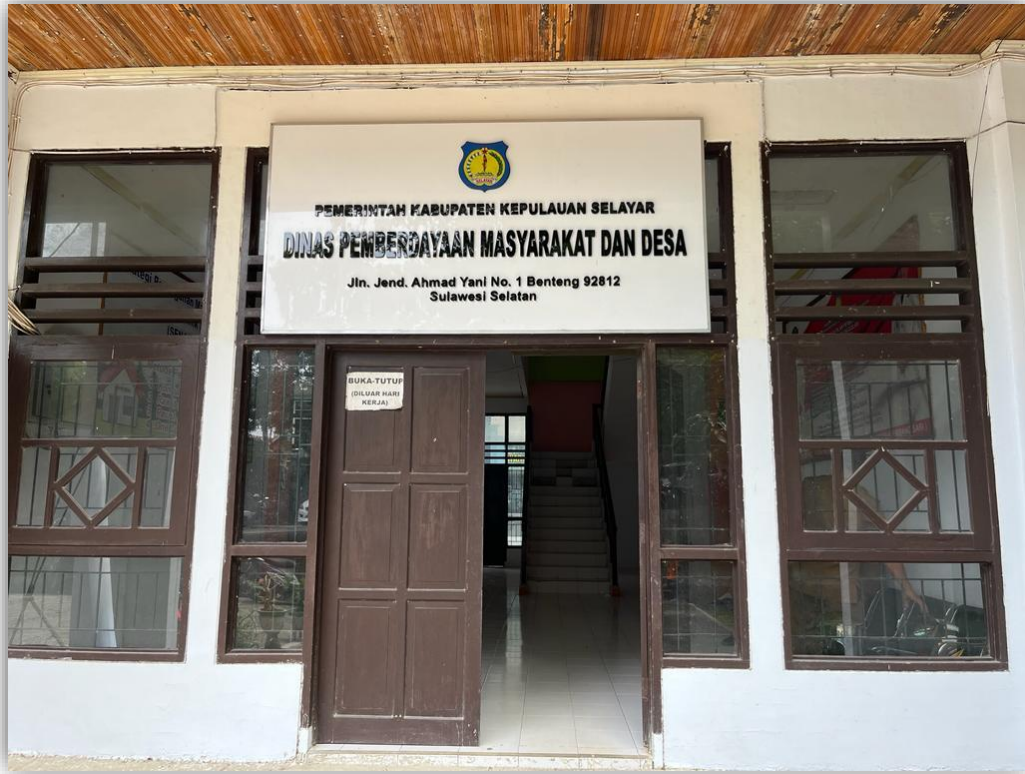
Gambar 1 Foto Kantor Dinas Pemberdayaan Masyarakat dan Desa

Alamat : Jln. Jend. Ahmad Yani Nomor 1 Benteng Titik Koordinat : -6,121287°, 120,466487° e-mail : pmdslyr@gmail.com